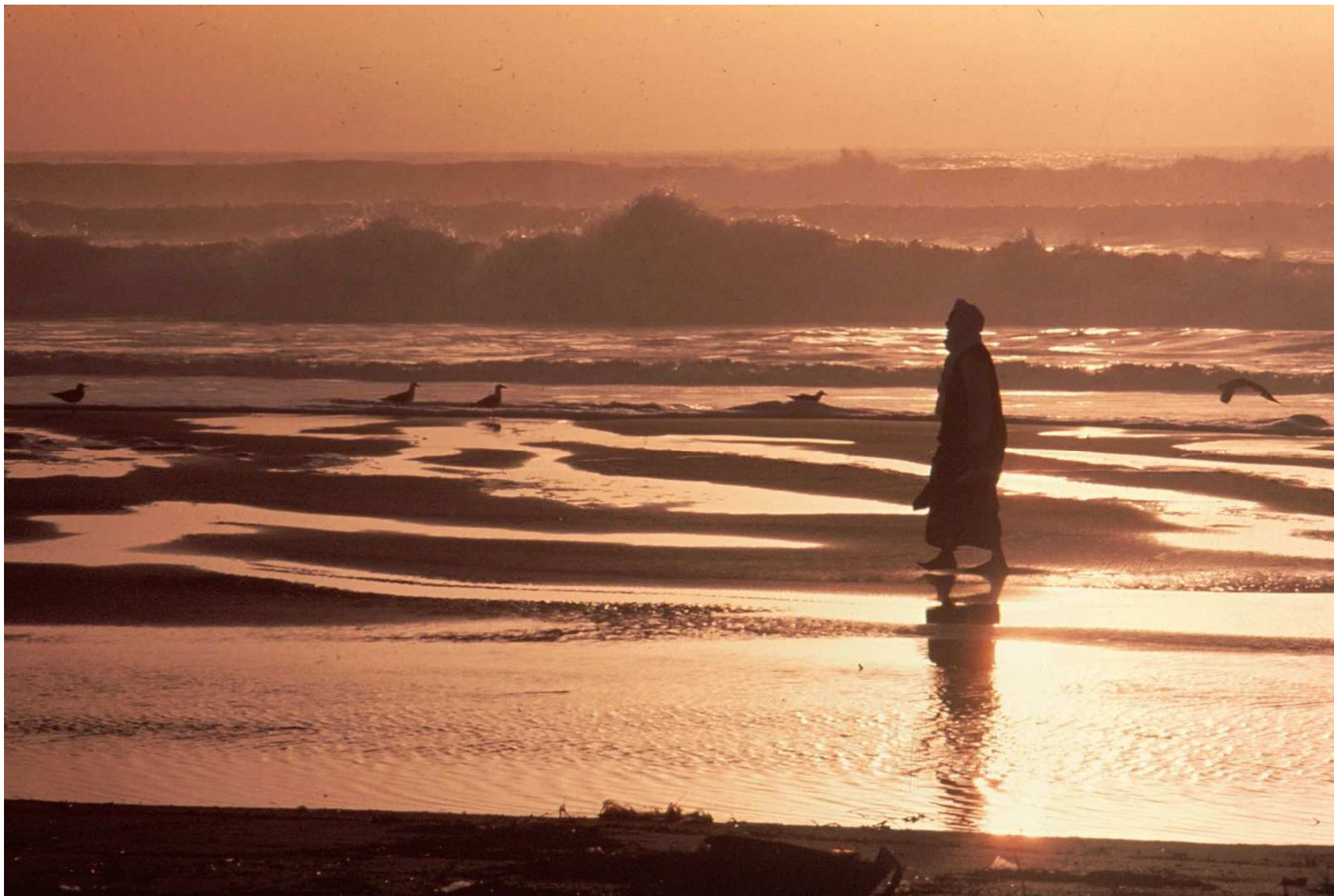
1977 - Sénégal - Sur la plage à Saint Louis